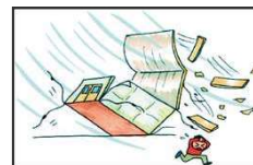
現場事務所などの仮設建物が、暴風のため崩壊した。