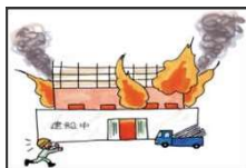
建築中の建物が火事になり全焼してしまった。

火災・台風・作業ミスなど(自然災害・人為的災害)による損害、工事期間中に工事現場で偶然な事故により工事対象物などに生じた損害を幅広く補償します。